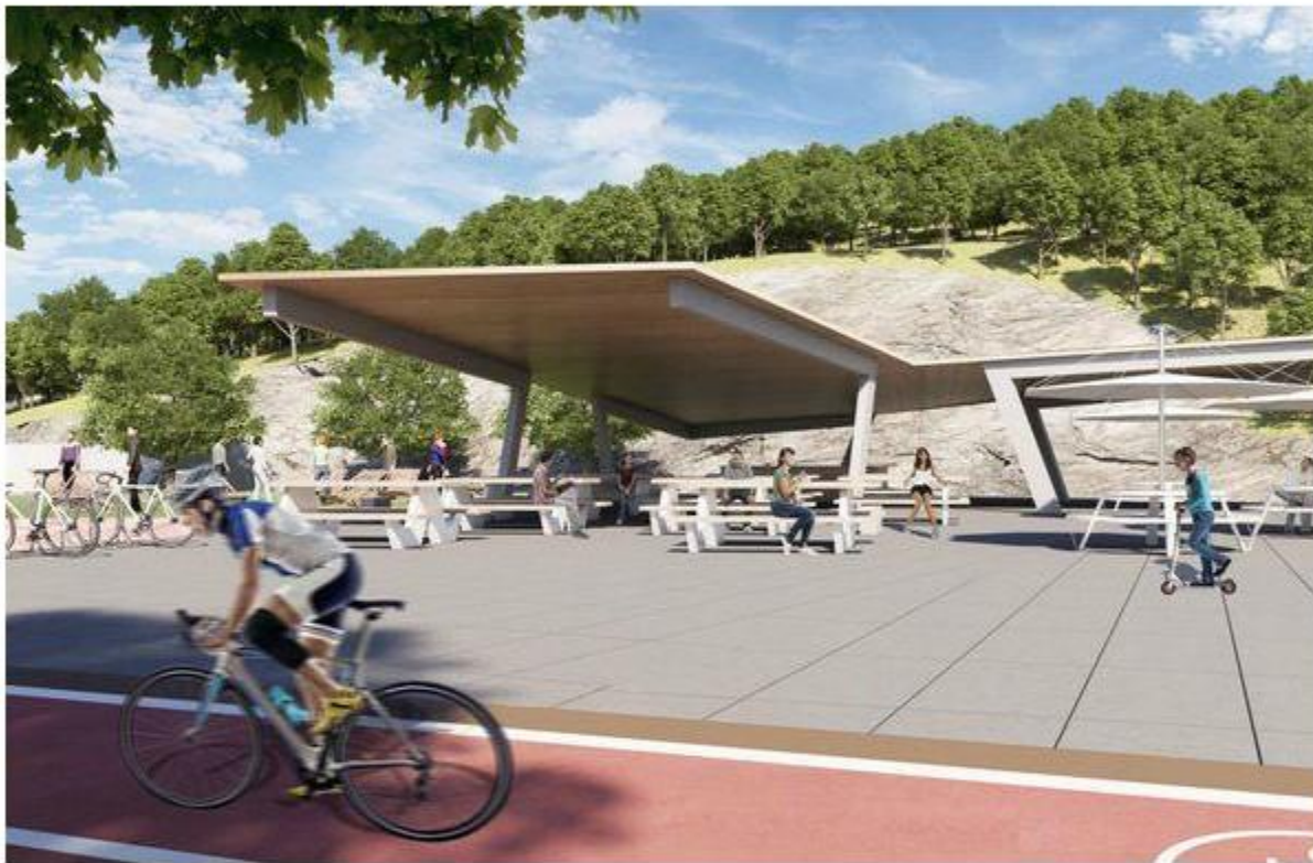
РЕКОНСТРУКЦІЯ НАБЕРЕЖНОЇ РІЧКИ ТЕТЕРІВ В МІСТІ ЖИТОМИРІ

ЗАМІНА ЗОВНІШНЬОГО ОСВІТЛЕННЯ НА LED-ОСВІТЛЕННЯ